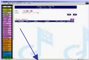
(分配エラーリスト画面)